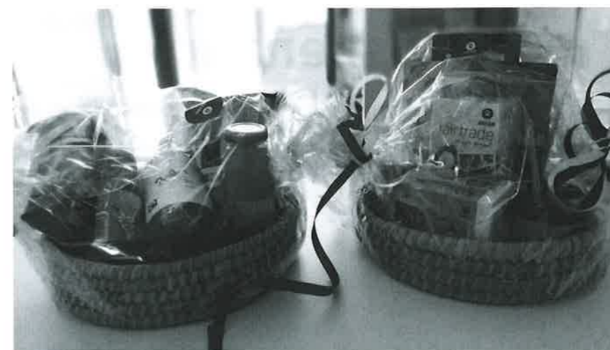
Dankzij gelote ontbijt- en aperitiefmanden konden inwoners tijdens de zomermaanden bij een hapje en drankje gezellig samen brainstormen.

Na afloop brachten de begeleiders van Levuur de verschillende ideeën samen. Vijf toekomstbeelden kwamen uit deze sessies naar boven: