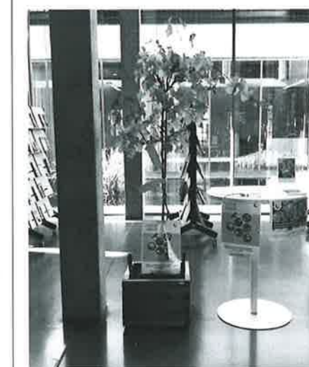
Aan de ideeënboom in het onthaal van het administratief centrum kunnen inwoners hun ideeën ophangen.

lege bekijkt dan wat er kan opgenomen worden in het meerjarenplan. In december geeft het bestuur ten slotte toelichting over het beleid en de manier waarop het de ideeën van de burgers hierin heeft verwerkt. Het bestuur engageert zich ook om de komende jaren de belangrijkste projecten participatief met de burgers vorm te geven.